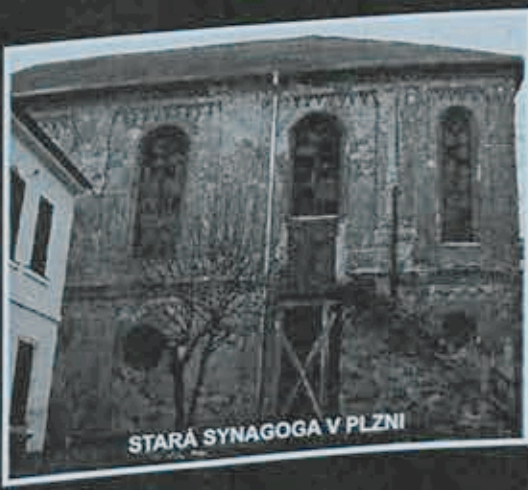
STARÁ SYNAGOGA V PLZNI

za mediální podpory: Českého rozhlasu Plzeň MF Dnes – regionální redakce pro Plzeňský kraj a Plzeňského deníku a jeho mutací