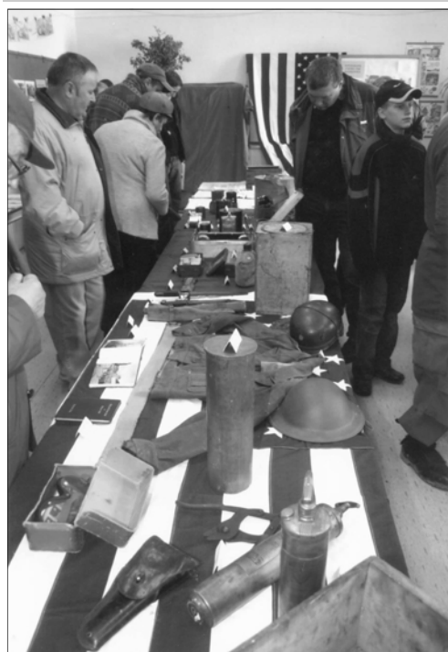
V budově základní školy na náměstí si potom mohli zájemci prohlédnout výstavu fotografií z doby osvobození obce a ukázky dobové výstroje americké armády