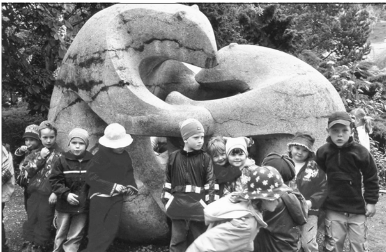
Děti ze třídy „Zajíčků“ u sochy medvědů v ZOO Plzeň.