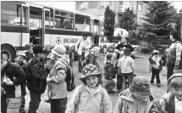
Návrat dětí ze ZOO Plzeň do Kasejovic