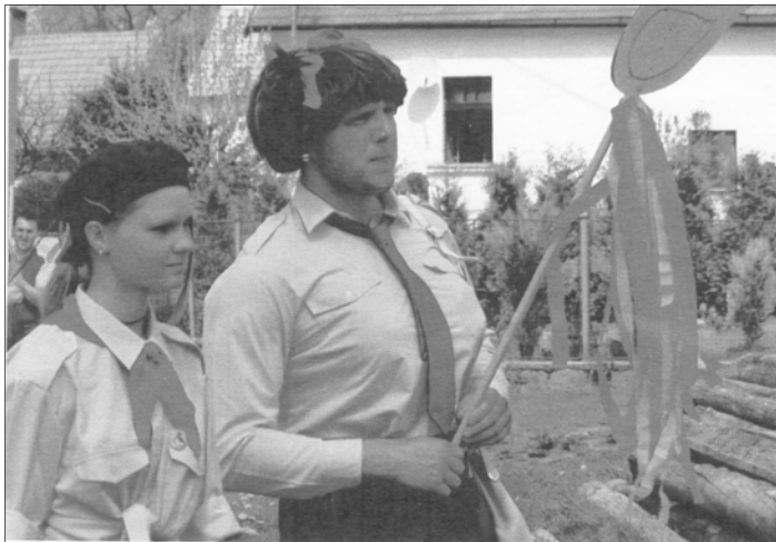
Recesní prvomájový průvod Řesanicemi

Průvod začal svou již tradiční pouť na seřadišti na začátku slavnostně vyzdobené obce. Do radostného budovatelského kroku nám vyhrávala muzika - všem známé motivační písně. I když začátek produkce byl ohrožen zapomenutím nahrávky v domě jednoho ze zúčast-