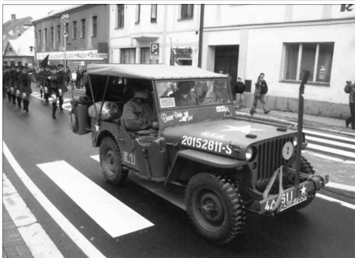
Poté se slavnostní průvod přesunul na náměstí.