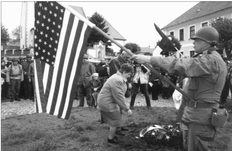
Poté se památce osvoboditelů poklonili zástupci obce.