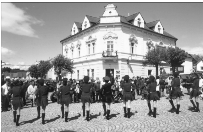
..... i jejich starších kolegyně.