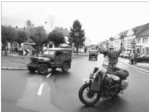
..... za kterými následovala kolona vojenských historických vozidel Klubu 4. obrněné divize US Army