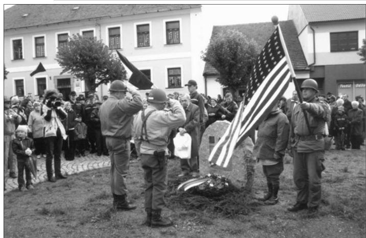
Po projevech následovalo odhalení pamětní desky vojáků z 90. pěší divize US Army, 4. obrněné divize US Army a 52. tankového praporu čs. obrněné brigády. Památku poté uctili členové Klubu 4. obrněné divize US Army.

(pokračování na str. 4) text –pl-