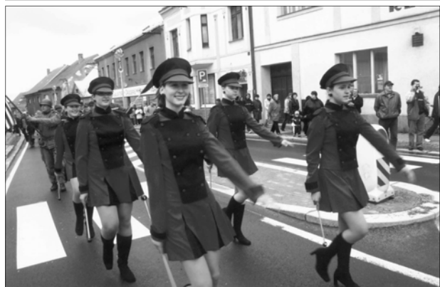
V čele průvodu pochodovali mažoretky a vojáci americké armády, .....