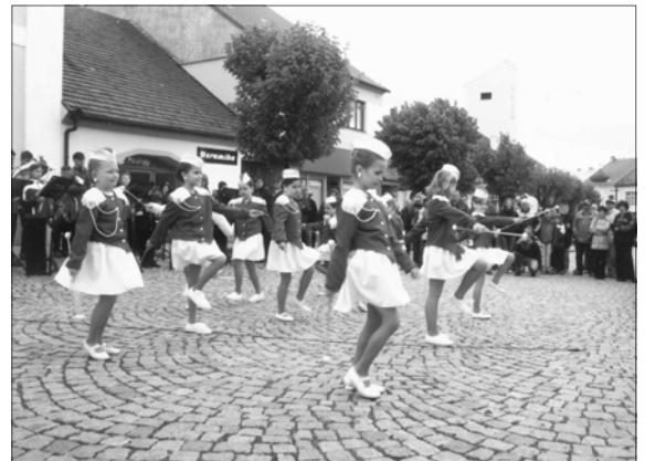
Po odhalení pamětní desky následoval kulturní program. Diváci, kterých se na slavnosti shromáždilo odhadem 350, mohli obdivovat umění malých mažoretek .....