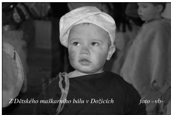
Z Dětského maskarního bálu v Dožicích