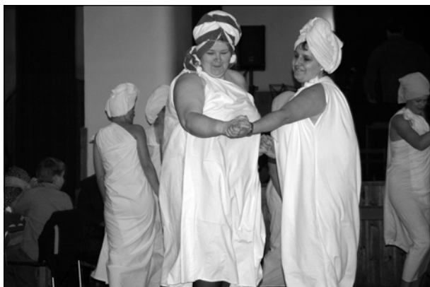
Vystoupení oseleckých žen při oslavě MDŽ v Oselcích

I v letošním roce se v Oselcích slavil Mezinárodní den žen. Již šestý ročník obnovené tradice připravil pro oselecké ženy Svaz dobrovolných hasičů Oselce. Více než sto oslavenek sledovalo vystoupení