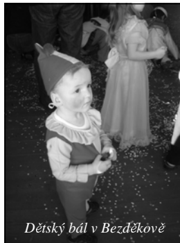
Dětský bál v Bezděkově