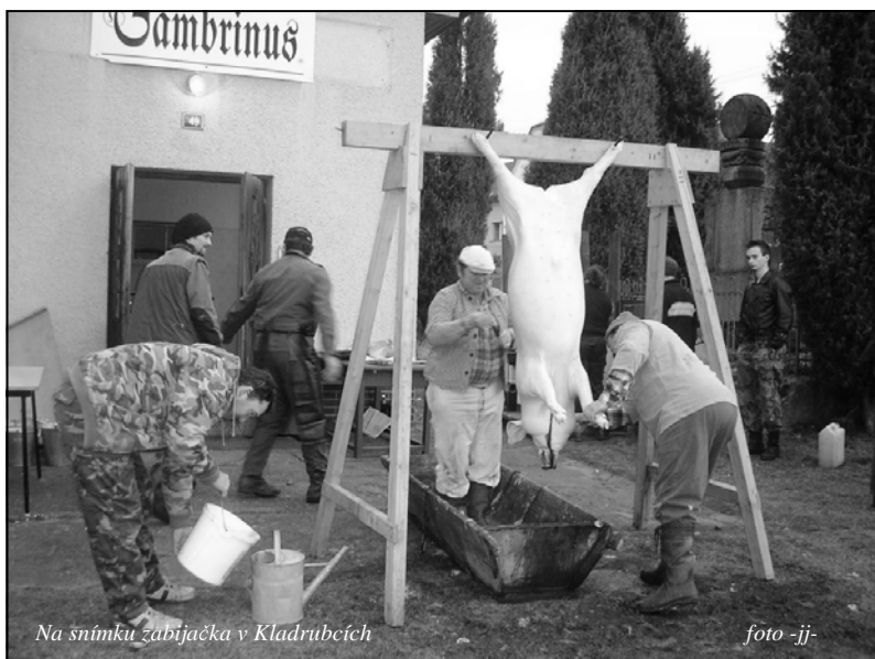
Na snímku zabijačka v Kladrubcích