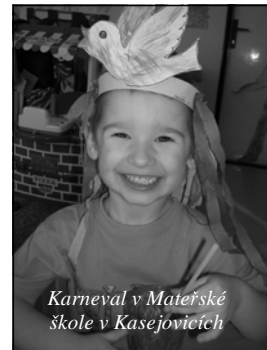
Karneval v Mateřské škole v Kasejovicích

Karnevalem každým rokem, příchod jara slavíme. Každý je tu maskovaný, nikdo neví, kdo to je. Kde se ukrýl chlapeček? Kde se skrývá holčička? Možná je to šášula, nebo malá kočička.