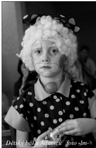
Dětský bál u Adamců

Již podruhé v letošním roce ožil sál restaurace U Adamců. Zatímco první únorovou sobotu se na rodičovském bále až do pozdních nočních hodin bavily desítky dospělých, druhou únorovou sobotu patřil sál především pohádkovým bytostem. V jejich přestrojení se přišly pobavit děti v doprovodu svých rodičů. Sálem tak létaly nejen čarodějnice, ale