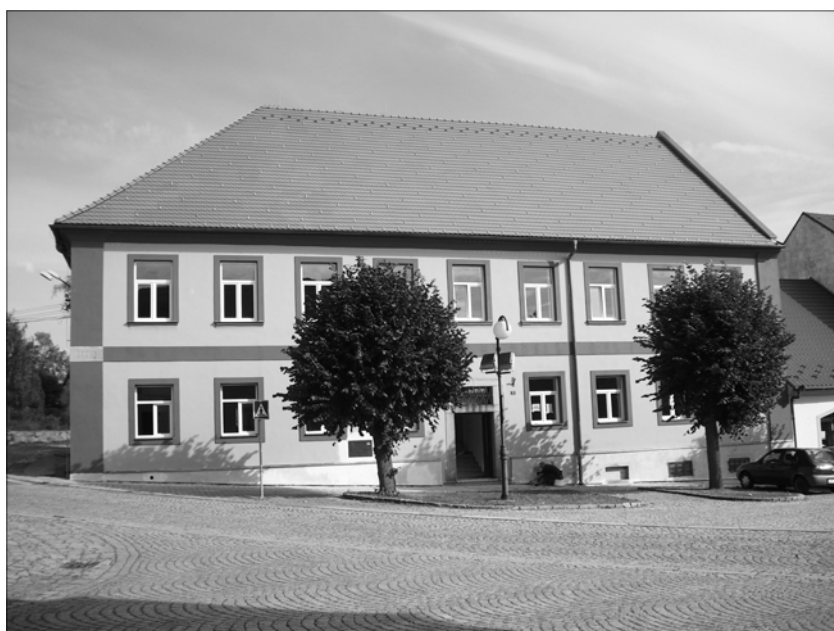
Zrekonstruovaná budova bývalé školy na náměstí v Kasejovicích

V prosinci loňského roku byla zahájena rozsáhlá rekonstrukce budovy staré školy na kasejovickém náměstí. Celá stavební akce byla rozložena do dvou etap. První etapa byla ukončena v dubnu 2009. O jejím průběhu jsme průběžně informovali na stránkách Kasejovických novin. Město Ka-