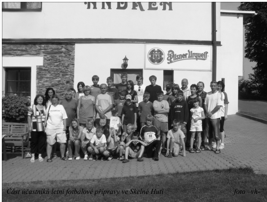
Část účastníků letní fotbalové přípravy ve Skelné Huti

První týden v srpnu se fotbalové týmy Tělovýchovné jednoty Sokol Kasejovice vypravily za letní fotbalovou přípravou do Skelné Huti u Nýrska. Letošního soustředění se oproti minulým rokům zúčastnil menší počet dětí, což nadělalo vrásky na čele především trenérům, kteří od letní přípravy očekávají sehraní týmů pro nacházející sezónu a samozřejmě fyzickou. I přes prvotní problém s nekompletností týmů se nakonec trenérům podařilo zorganizovat mladým fotbalistům jistě zajímavý sportovní týden. Náročné tréninky doplněné v případě žáků a dorostu o cyklistiku vyvážilo příjemné prostředí penzionu Andrea ve Skelné Huti, jenž kromě sportovního zázemí nabízí další vyžití pro volný čas. -mr-