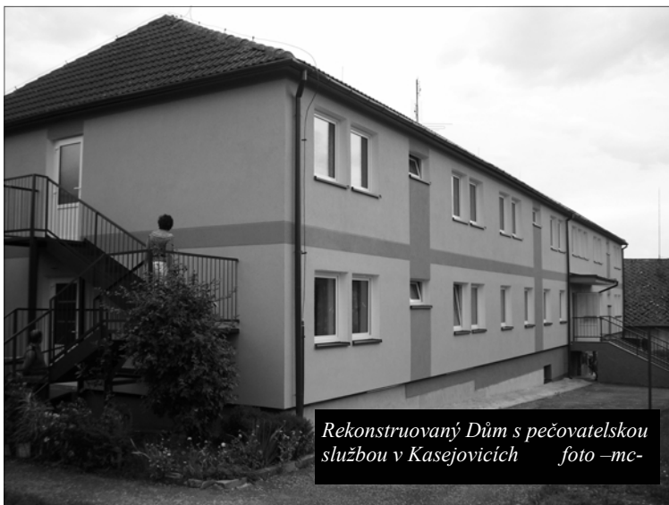
Rekonstruovaný Dům s pečovatelskou službou v Kasejovicích

Dále Město Kasejovice zakoupilo do sportovního areálu dva kusy mobilních toalet a dva kusy dětských atrakcí – skluzavku a houpadlo a vybudovalo opěrnou zeď mezi kurty a hokejbalovým hřištěm. Veškeré stavební práce si vyžádaly finanční prostředky ve výši 419 516 korun, přičemž 281 tisíce byla celá akce podpořena Programu obnovy venkova České republiky.