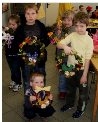
Takhle krásné věnečky si děti se svými rodiči vyrobily.