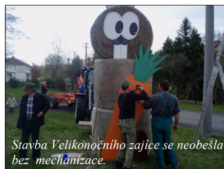
Stavba Velikonočního zajíce se neobešla bez mechanizace.