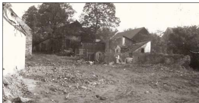
Pohled do dvora domu č.29 po demolici v r. 1974. Zbytky zdi (tmavé nízké) zcela vpravo je místo bývalé lednice, kde údajně býval vchod do podzemní chodby.

navštěvovat hostince Na Růžku, U Ježků a zejména Hotel Adamec. Místní fotbalové mužstvo našlo své útočiště v hostinci U Sladkých, zvaném také Na schůdkách a jeho skalní příznivci je následovali. Světová hospodářská krize v 30. letech minulého století způsobila nedostatek peněz mezi obyvatelstvem, dosud hojně navštěvované výroční trhy přišly o prodejce i kupce a tím klesaly i tržby v místních hostincích.