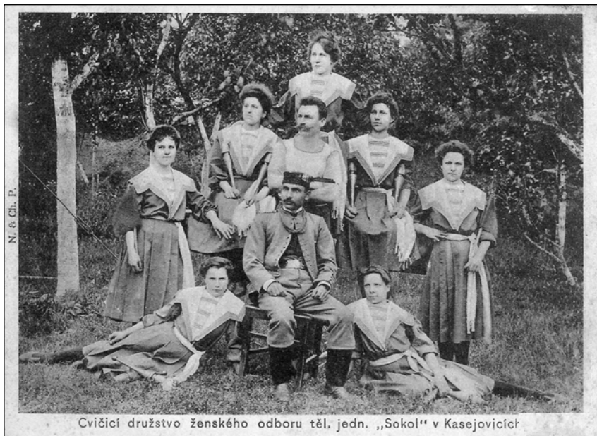
Cvičící družstvo ženského odboru těl. jedn. „Sokol“ v Kasejovicích

V Havelkovně měla své sídlo od r. 1897 TJ sokolská, na snímku družstvo ženského odboru zhruba z roku 1910.