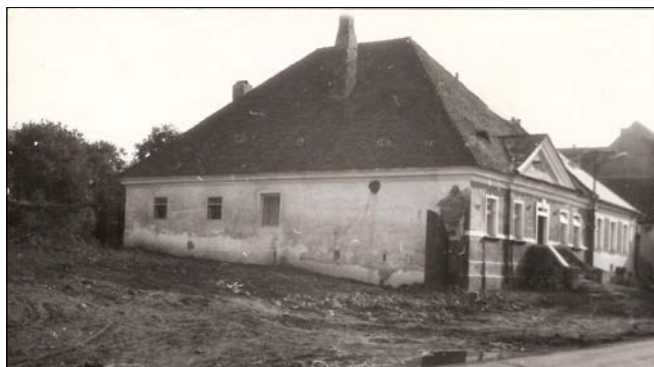
Dům č.30, hostinec U Sladkých zvaný také Na schůdkách a část proluky vzniklé demolicí domu č.29.