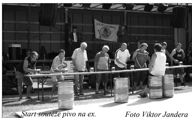
Start soutěže pivo na ex.

V sobotu i v neděli bude v patře budovy probíhat výstava o historii a současnosti kasejovického fotbalu a TJ Sokol Kasejovice.