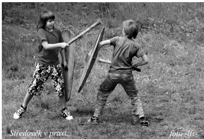
Středověk v praxi.