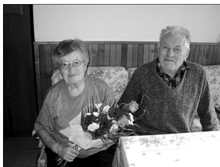
Manželé Hlavničkovi z Budislavic