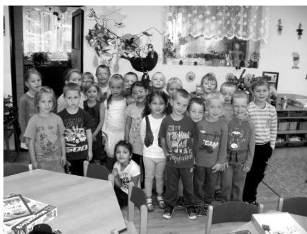
Třída U Vodnička.