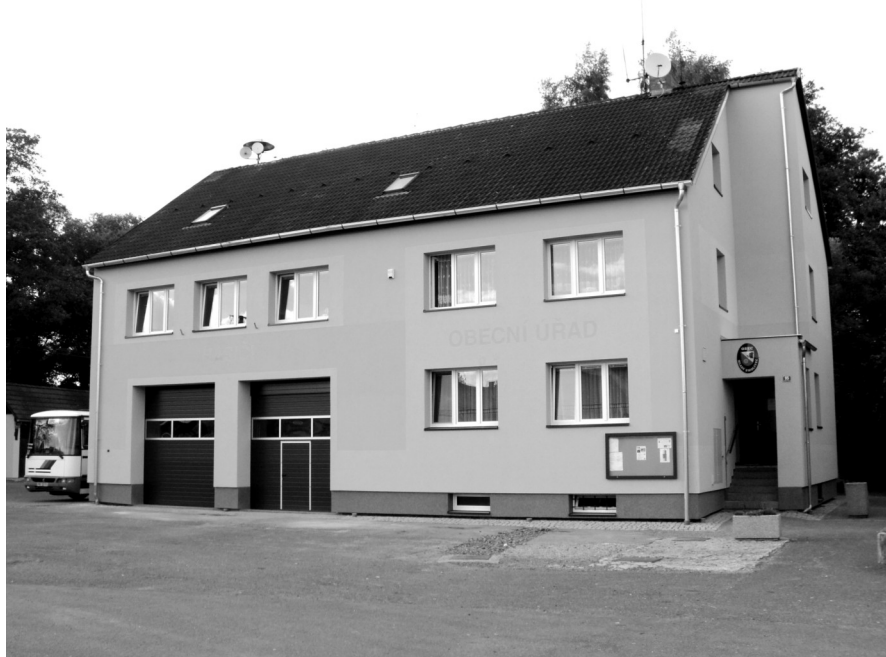
Budova obecního úřadu a hasičárny v Mladém Smolivci v novém kabátě.