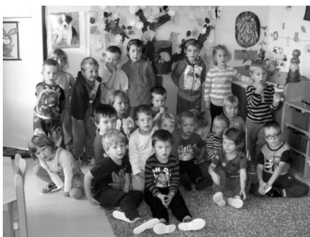
Třída U zajička.