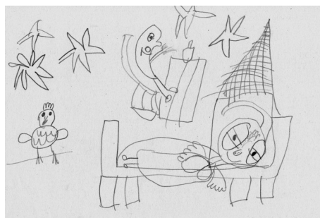
Skřítko Postelníčka nakreslila Kačenka Červená.