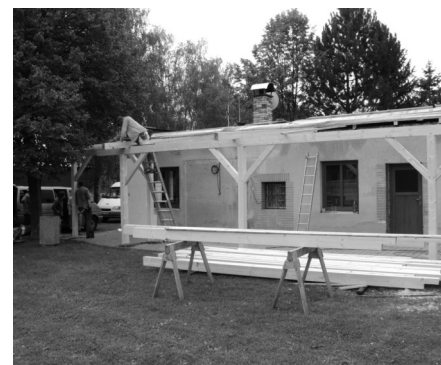
Stavebními úpravami prochází též šatny ve Starém Smolivci

Zároveň s obecním úřadem zateplujeme i šatny sportovců ve Starém Smolivci, na které jsme také obdrželi příslib přidělené dotace. Šatny se