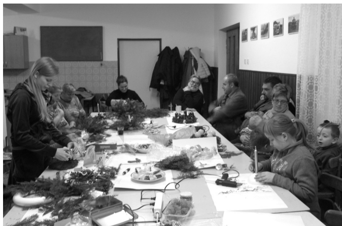
První adventní neděli přivítali v Chloumku tradičně společnou výrobou vánočních dekorací