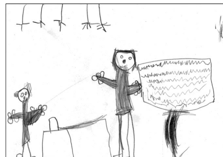
Předškoláči u zápisu, nakreslil Václav Adamec.

Mateřská škola Kasejovice „Veselá školka - školka plná písniček a hrajících si dětiček“ vás srdečně zve na Zápis dětí pro školní rok 2015- 2016