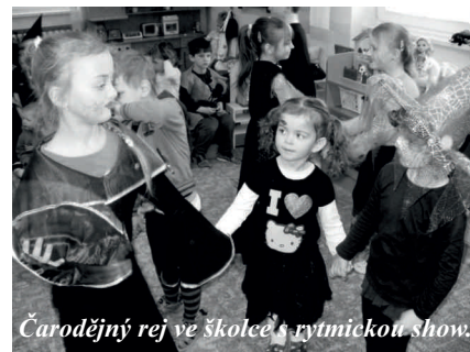
Čarodějny rej ve školce s rytmickou šou.