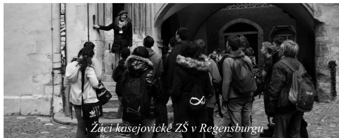
Žáci kasejovické ZŠ v Regensburgu