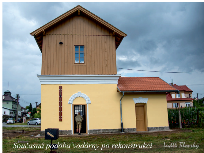
Současná podoba vodárny po rekonstrukci Luďek Blovský