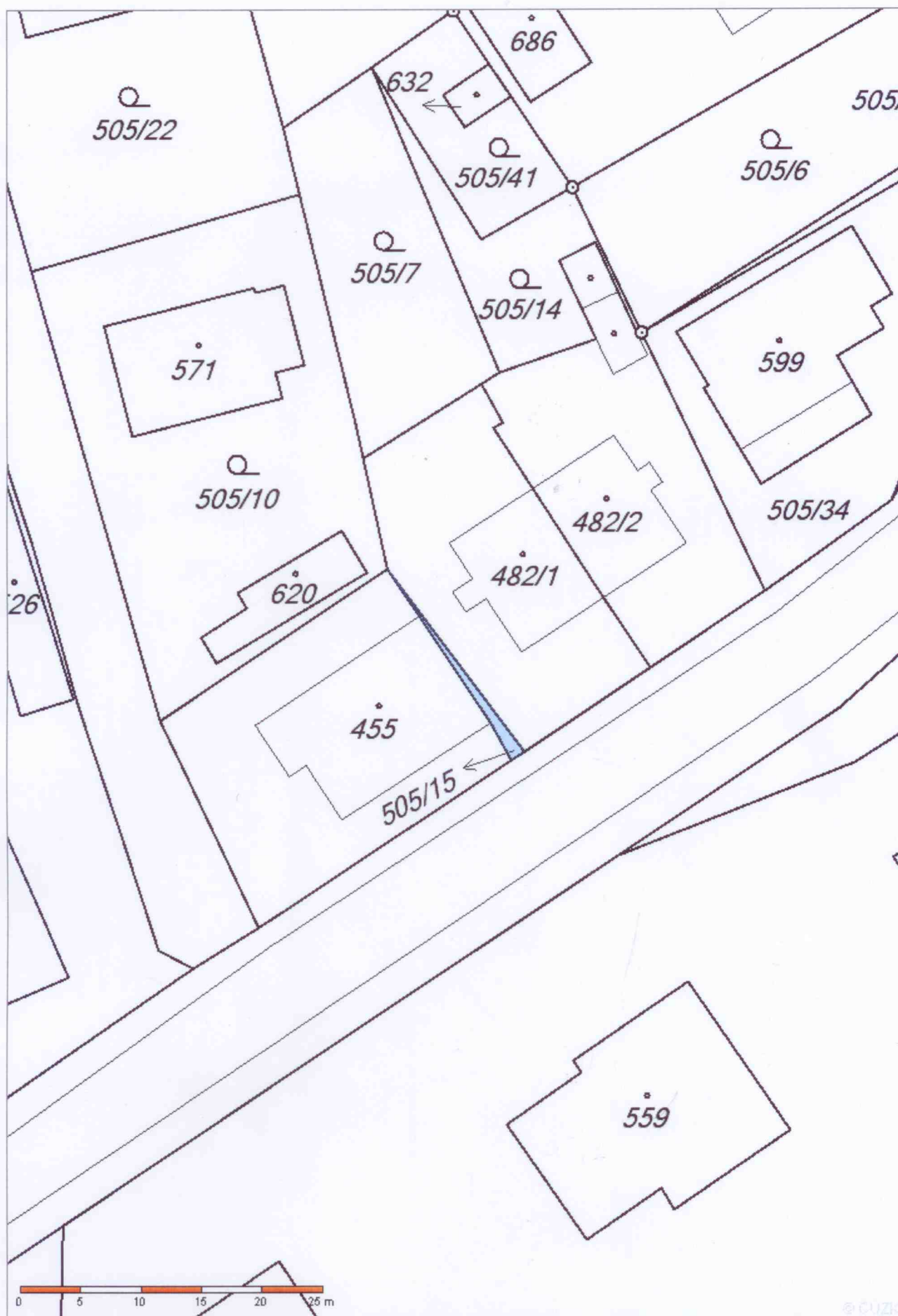
parc. č. 505/15 o výměře 10 m 2 v k.ú. Kasejovice