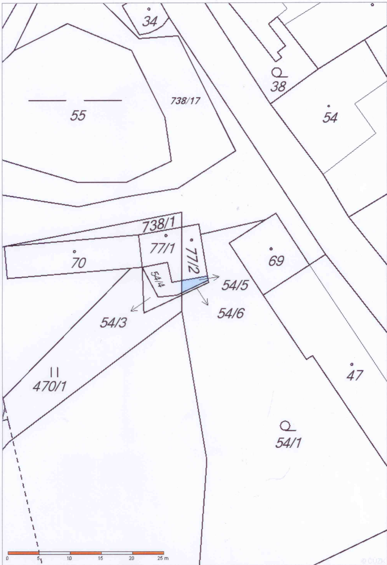
parc. č. 54/5 o výměře 9 m 2 v k.ú. Kladrubce